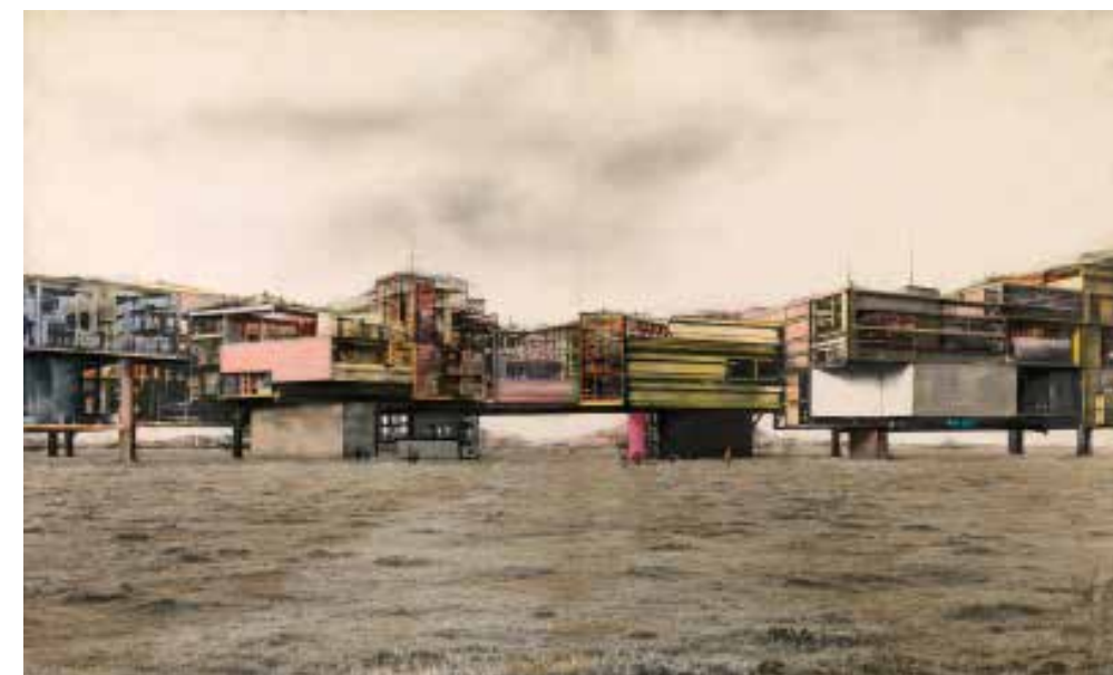
Constant, Gezicht op New Babylonische sectoren, 1971 t/m 25 september te zien in het Gemeentemuseum Den Haag

Het Cobra Museum en het Gemeentemuseum Den Haag laten in twee gezamenlijk voorbereide tentoonstellingen zien welke weg Constant aflegde tussen de Cobra-jaren en het inmiddels wereldberoemde New Babylon-project (1956-1975). In Den Haag wordt groots aandacht besteed aan de Babylon-maquettes en assemblages, voorstel voor een nieuwe manier van leven en wonen in een wereldomspannend netwerk van architectonische cellen op 16 meter hoogte boven de grond. Homo ludens , de van arbeid bevrijde wereldburger, zou er zich