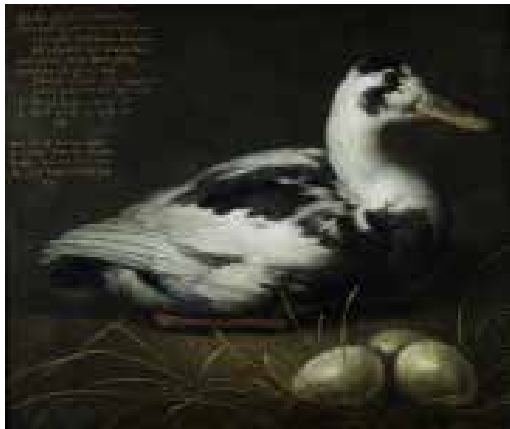
Aelbert Cuyp, Portret van de eend Sijctgen, 1647-1650 t/m 11 september te zien in het Dordrechts Museum