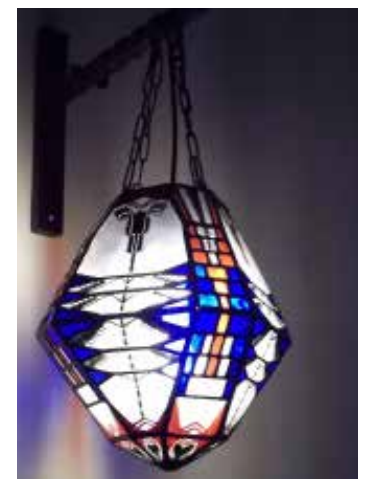
Willem Bogtman, Hanglamp, ca. 1920 t/m 28 augustus te zien in het Stedelijk Museum, Amsterdam