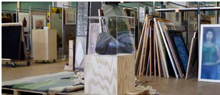
Depot van de Stichting Ontferd Goed in Den Bosch

Moroni werd rond 1522 geboren in Bergamo, waar hij zo'n 57 jaar later ook is gestorven. Bijzonder voor zijn tijd is dat hij geen geïdealiseerde portretten schildert. Rimpels, vetbulten,