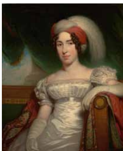
Charles Howard Hodges, Portret van Cornelia Maria Petronella van der Kun, ca 1810 t/m 31 mei te zien in Museum De Lakenhal, Leiden

die tijd is de tentoonstelling niet. Eerder een terugblik op Fuchs' kunsthistorische vorming en ontwikkeling. Hij geeft de les door dat een kunsthistoricus vooral moet kijken en zich niet te veel door de historische context moet laten afleiden. De parade heeft daardoor iets weg van een moderne installatie.