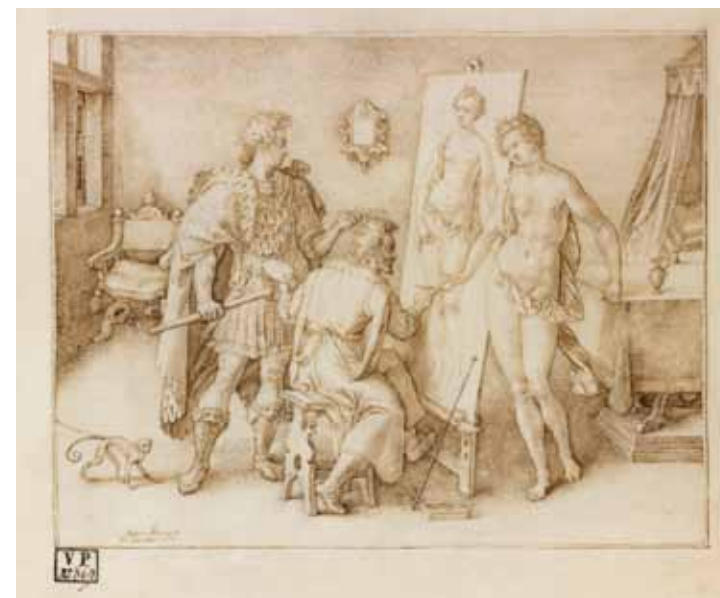
Jan Wierix, Het atelier van Apelles, 1600

t/m 25 januari te zien in het Museum Mayer van den Bergh, Antwerpen