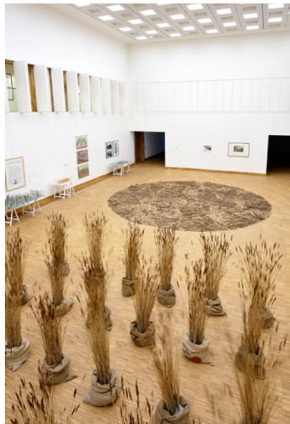
Expeditie Land Art, t/m 3 januari in KaDE, Amersfoort