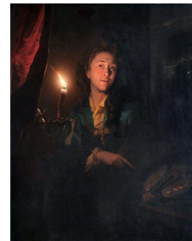
Godfried Schalcken, Portret van Mary Wentworth, 1693 t/m 24 januari te zien in Walraff-Richartz-Museum in Keulen

Dit is Van der Heck. Schilderswerkplaats in de Gouden Eeuw Stedelijk Museum Alkmaar t/m 24 januari www.stedelijkmuseumalkmaar.nl