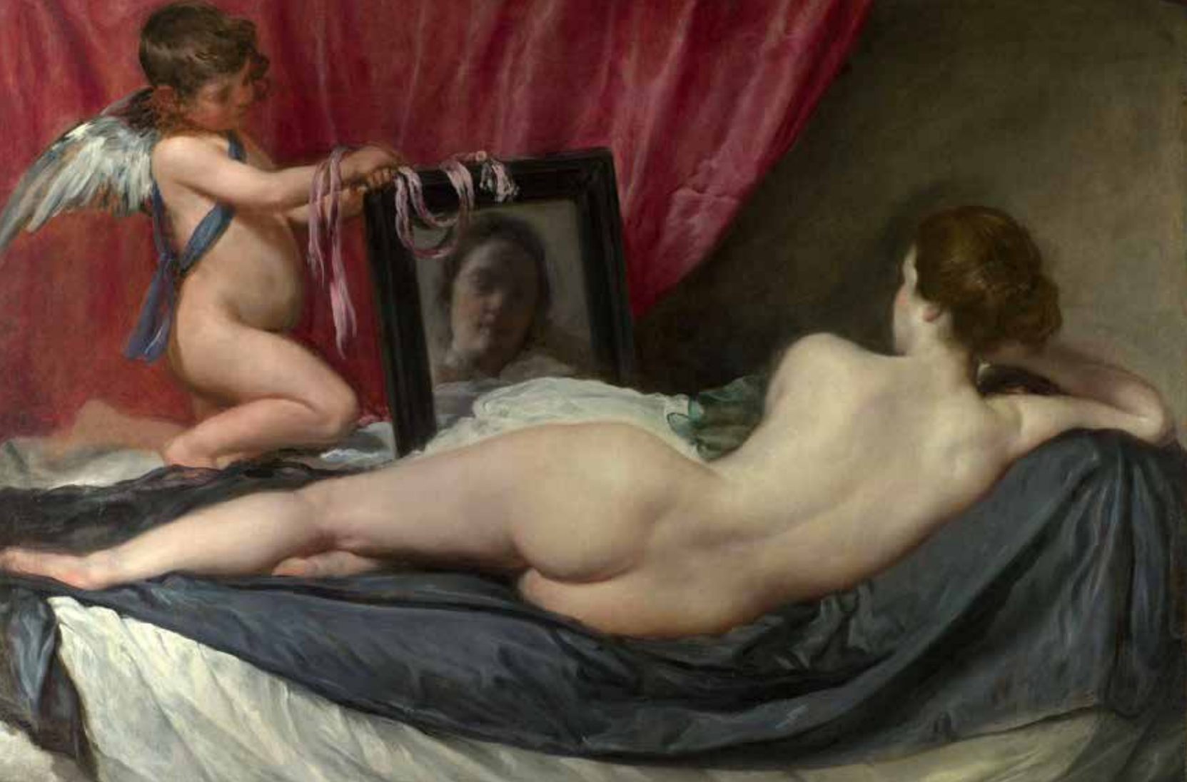
4 Diego Velázquez Venus voor de spiegel (' The Rokeby Venus '), 1647-1651 • olieverf op doek, 122,5 x 170 cm • The National Gallery, Londen