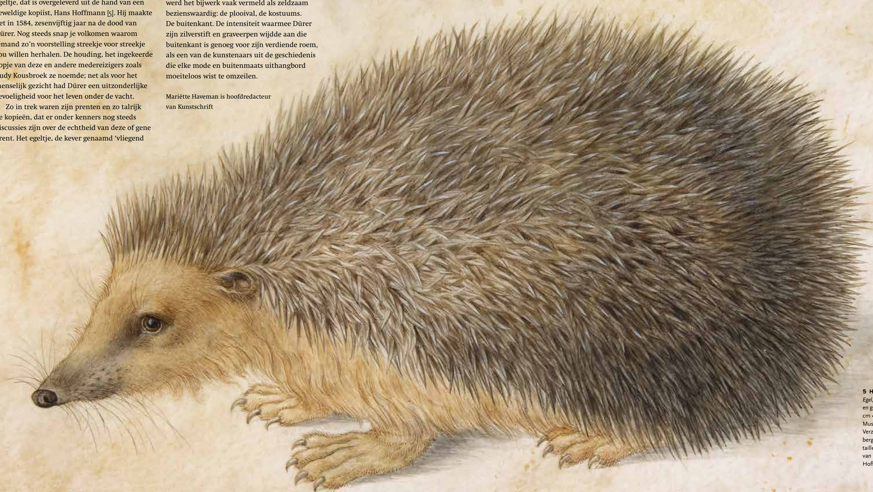
5 Hans Hoffmann Egel , voor 1584 • waterverf en gouache, 20,7 x 30,7 cm • The Metropolitan Museum of Art, New York. Verzamelaars in Neurenberg bezaten zeer gedetailleerde natuurstudies van Dürer en voorzagen Hoffmann van inspiratie.