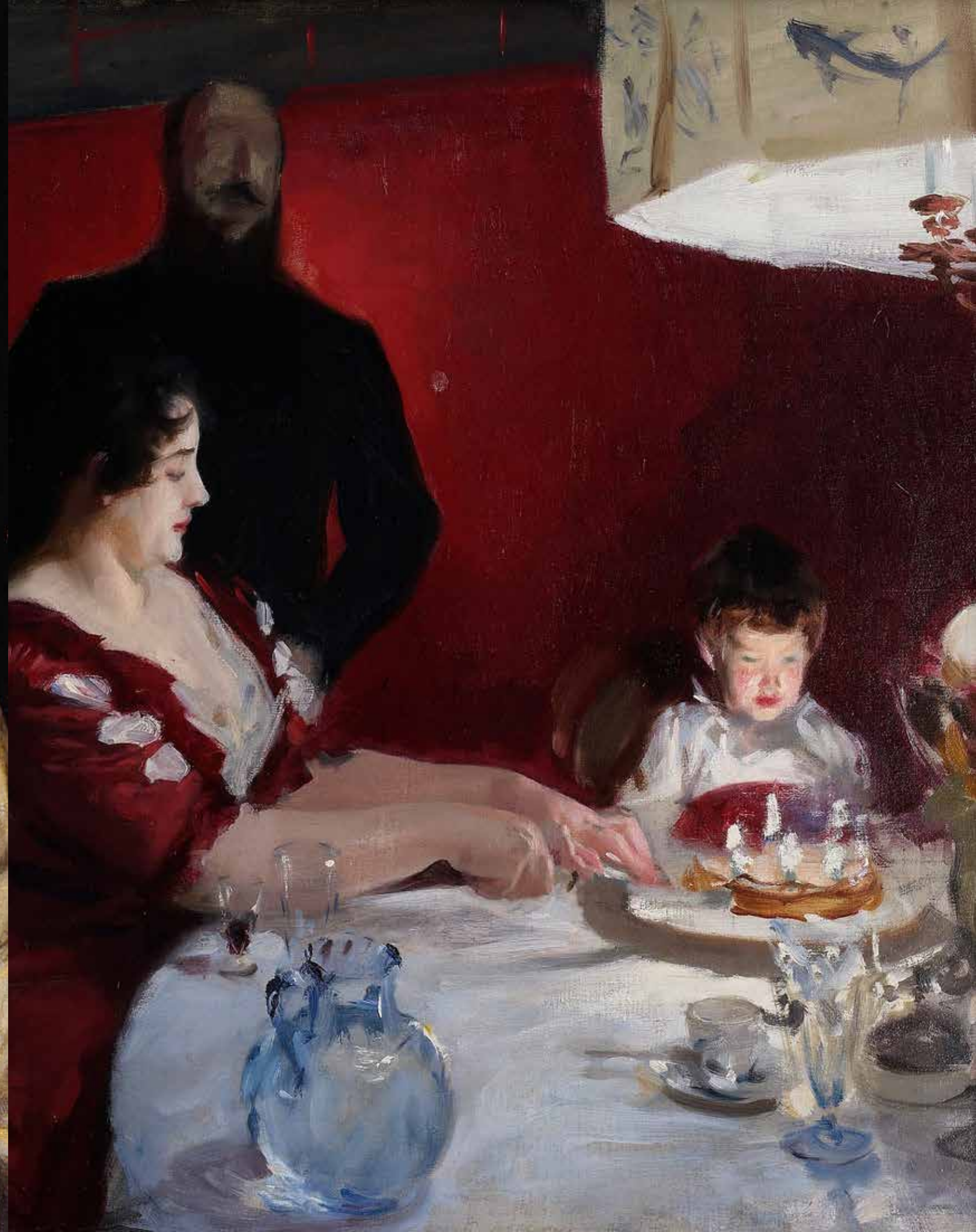
>7 John Singer Sargent Het verjaardagsfeest, 1887 • olieverf op doek, 61 x 73,7 cm • The Metro- politan Museum of Art, New York