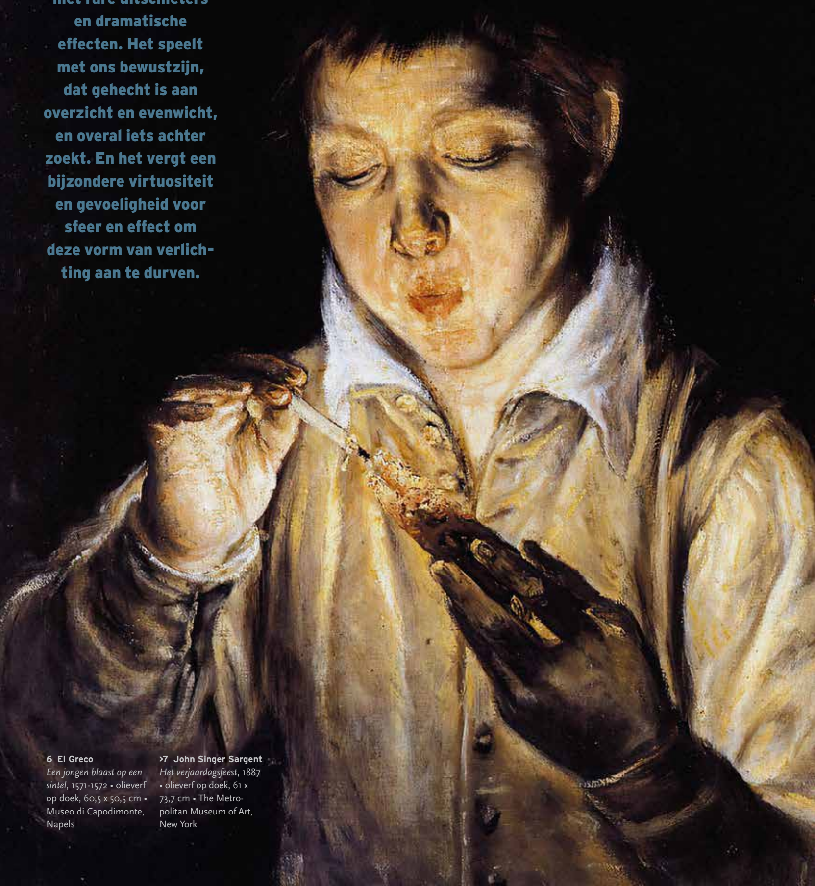
6 El Greco Een jongen blaast op een sintel, 1571-1572 • olieverf op doek, 60,5 x 50,5 cm • Museo di Capodimonte, Napels

Kaarslicht spreekt een eigen visuele taal, met rare uitschieters en dramatische effecten. Het speelt met ons bewustzijn, dat gehecht is aan overzicht en evenwicht, en overal iets achter zoekt. En het vergt een bijzondere virtuositeit en gevoeligheid voor sfeer en effect om deze vorm van verlichting aan te durven.