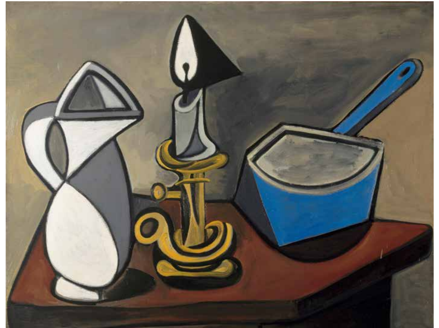
5 Pablo Picasso Kruik, kaars en emailen pan , 1945 • olieverf op doek, 82 x 106,5 cm • Centre Pompidou, Parijs

In de eeuwen voor de negentiende was de walmende pit, gedoopt in olie of was, de enige lichtbron, en daarom is het opmerkelijk dat datzelfde kaarslicht ook toen al omgeven was met een geur van mysterie. Wie zijn dierbare dode eer wilde brengen, ontstak een kaarsje; heilige of heel deftige doden kregen er veel. Zo was dat, eeuwenlang. En nog steeds, nu licht alomtegenwoordig is en duisternis schaars, is het sacrale of spirituele nergens beter door op te roepen dan door de beweeglijke, kleine kaarsvlam. Voor praktische doeleinden is die kwaliteit een nadeel, maar voor kunstenaars die