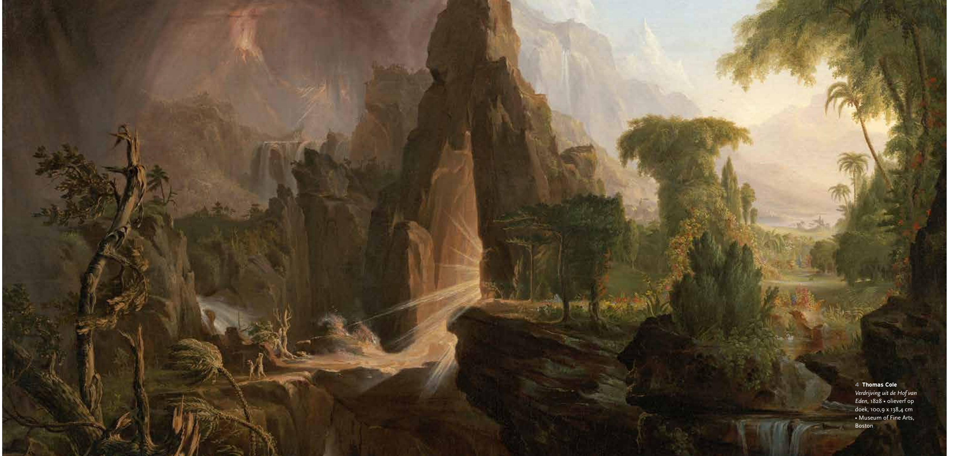
4 Thomas Cole Verdrijving uit de Hof van Eden , 1828 • olieverf op doek, 100,9 x 138,4 cm • Museum of Fine Arts, Boston

van ons onuitputtelijke vermogen om die angst bevattelijk te maken, met behulp van een verhaal. Dat is de kiem van de wonderbaarlijk rijke traditie in de literatuur en ook de beeldende kunst die zich rond dit thema heeft gevlochten. In de beeldende kunst ontmoeten we telkens opnieuw de dieren die klaarstaan om zich in te schepen: leeuw, paard, olifant en pelikaan, geduldig wachtend op hun beurt om de loopplank over te gaan [1]. Later kwamen ook andere kanten van het verhaal in beeld: de periode vlak voor de vloed, in het verdorven paradijs, en de tijd van daarna, toen het water was geweken.