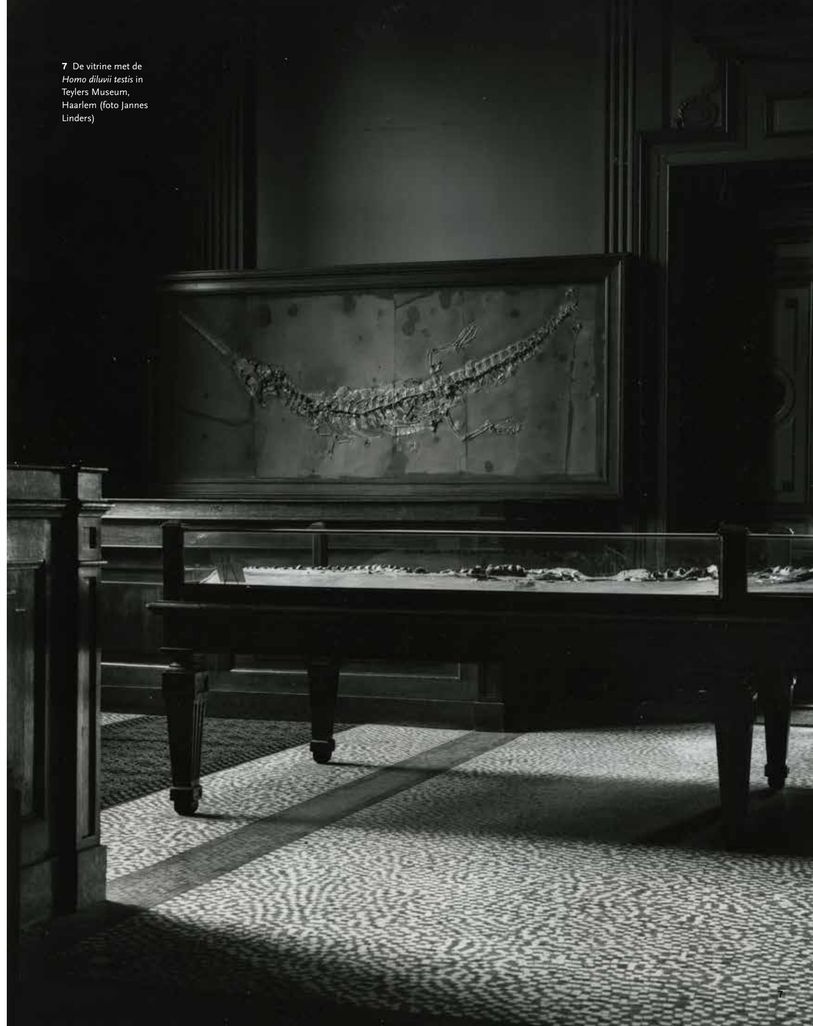
7 De vitrine met de Homo diluvii testis in Teylers Museum, Haarlem