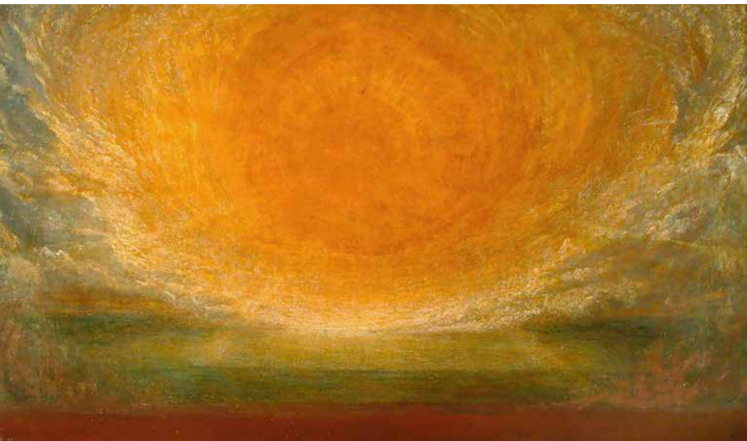
5 George Frederic Watts Na de zondvloed (De eenenveertigste dag) , 1886-1891 • 142,2 x 111,8 cm • Watts Gallery – Artists' Village, Guildford